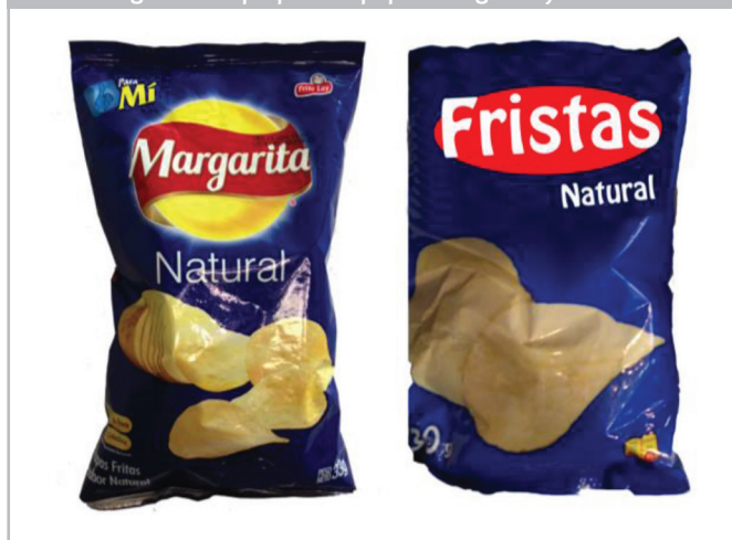
Figura 1. Empaques de papas Margarita y Fristas

Por tanto, Fristas se diseñó pensando en que el consumidor pudiera reconocer rápidamente el empaque de Fristas como un producto de la categoría de papitas pero con cualidades semejantes al líder: Margarita. Papas Margarita es un producto que está en el mercado colombiano desde 1950 (Papas Margarita, 2015) y en el 2014 logró una participación de 17,2% en volúmenes de ventas en la categoría de pasabocas, lo que le otorga el liderazgo en el mercado (Euromonitor, 2014). Gracias a su tradición y mayor participación de mercado con respecto a la categoría, Margarita ha logrado construir en la mente de los consumidores unas características físicas, simbólicas y funcionales particulares. Así, Fristas se diseñó con un color, forma, tamaño y características semejantes a los que tiene papas Margarita en su empaque de papas de sabor natural (Figura 1).