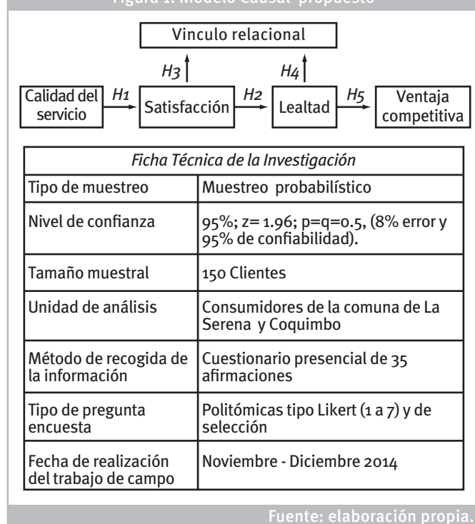
Figura 1: Modelo Causal propuesto