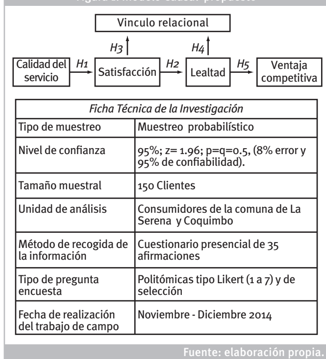
Figura 1: Modelo Causal propuesto

compuesta por 56,2% de personas menores a 41 años y en total 61,4% de hombres. La Ficha Técnica de la investigación se presenta en Tabla 1.